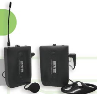
• WTS Series 無線翻譯系統