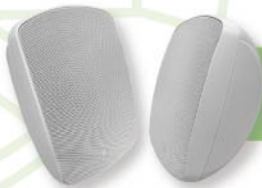
• AWS - 6502 弧背型防水喇叭