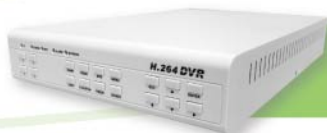
• L084 4CH 影像處理器